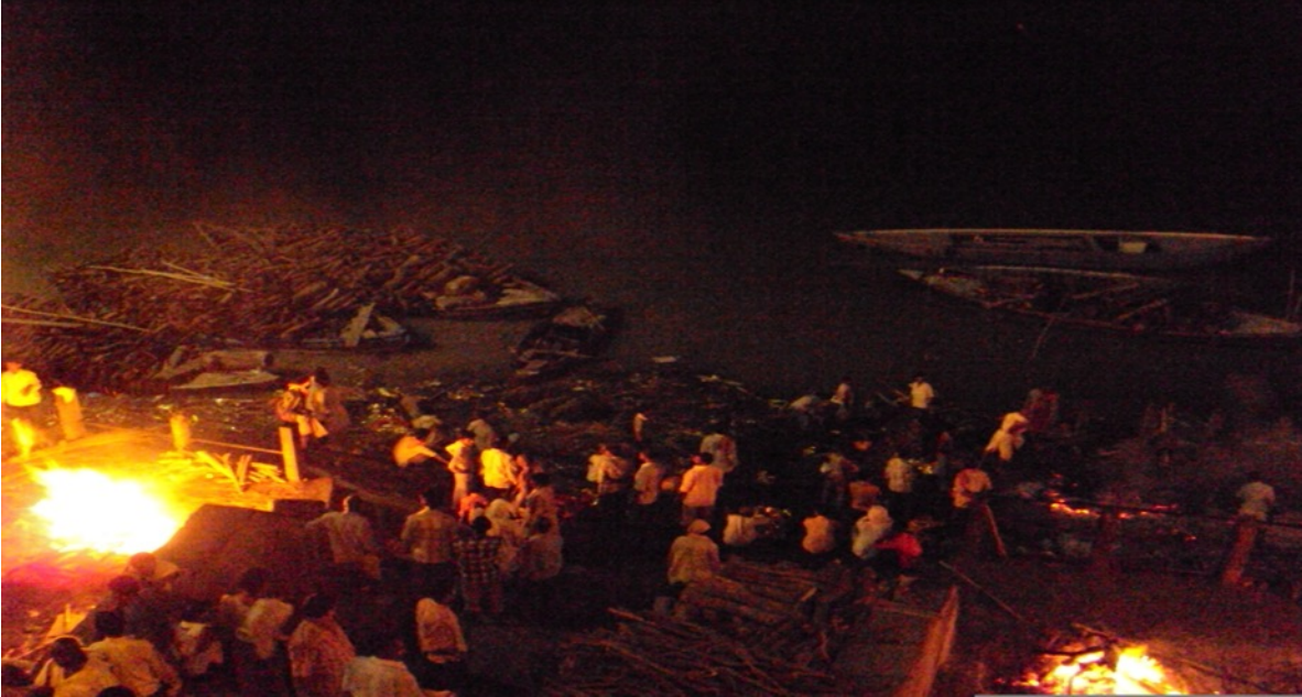
Varanasi, India

Reflexión: ¿Por qué para México es tan importante la autosuficiencia o independencia en productos e insumos energéticos y básicos? ¿Mayor producción interna?