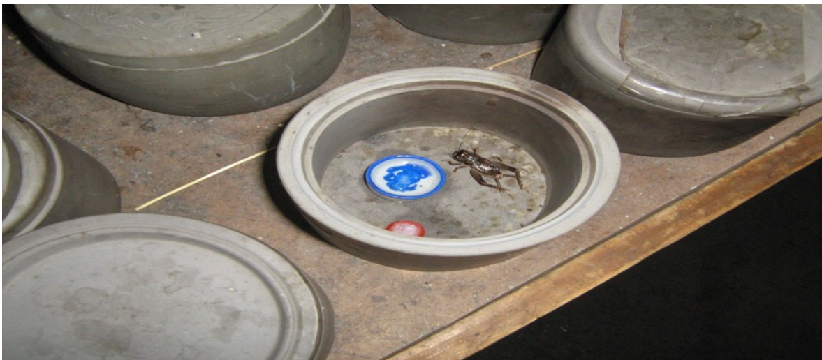
“Grillo de pelea” en una calle de Shanghai, Ver Cricket fight in China

¿Bolivia y China no son otros casos en que la autosuficiencia, producción y consumo internos han rendido frutos junto con el aprovechamiento de sus recursos humanos y naturales?